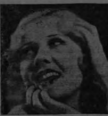
Antes Pago de Colombia Victoria

En campo del Juventud Atlántida, a las nueve, tuvo lugar este encuentro, contra Libertad. La Juventud alinéó en este juego un conjunto bastante bueno, pues se esperaba por parte de los hinchas de este equipo ganar al cuadro blanquinegro de La Libertad, el que, a la par del Excelsior, tiene muchas probabilidades de ser campeón en su categoría del año 33 y así poder contar en sus haberes el galardón que significa un triunfo frente a los pibes de La Libertad; pero los libertos se salieron con la suya, jugando como de costumbre; lograron dominar y anotar cuatro tantos por uno de la Juventud.